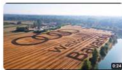
Nachhaltige Feldwerbung: AUDI Logo auf 91.000 Quadratmeter... 29.086 Aufrufe • vor 1 Jahr