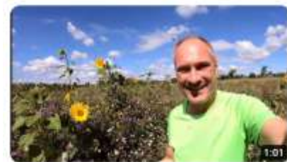
Feldwerbung ist eine Bienenweide 27.814 Aufrufe • vor 4 Monaten